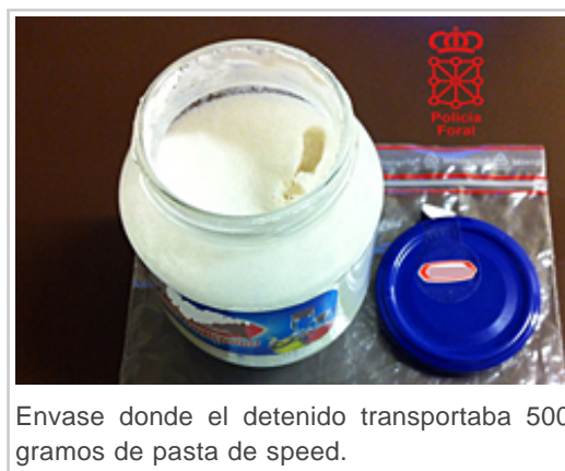
Envase donde el detenido transportaba 500 gramos de pasta de speed.

Tras dar el alto reglamentario al vehículo e inspeccionar su interior, los agentes descubrieron una bolsa en la que se encontraba, junto a unas cebollas, un bote de mahonesa lleno pero sin el precinto habitual. Cuando los agentes abrieron el envase vieron que contenía una pasta con el mismo olor que el speed. Al parecer, la finalidad de las cebollas era disimular el olor característico de esta droga. El conductor fue detenido.