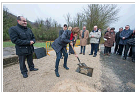
La Presidenta Barcina echa tierra sobre la primera piedra de la nueva red de aguas de Ultzanueta.

El proyecto propone la utilización simultánea y conjunta de varios manantiales de la zona, con el fin de realizar una explotación más racional y equilibrada del agua y evitar, así, el déficit que algunas de las poblaciones sufrían en épocas de estiaje. La idea es aprovechar los