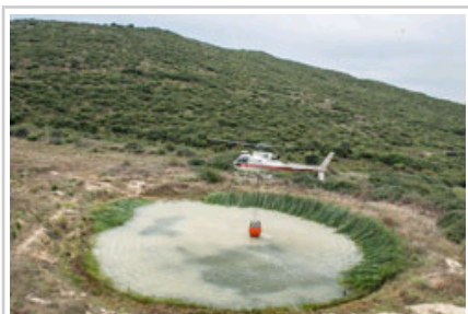
Un helicóptero de la ANE toma agua de una balsa