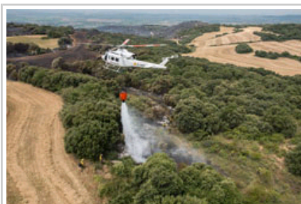
Los medios aéreos han reanudado su actividad a primera hora de la mañana