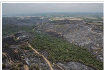
Se han visto afectadas por las llamas una 900 hectáreas, según la primera estimación