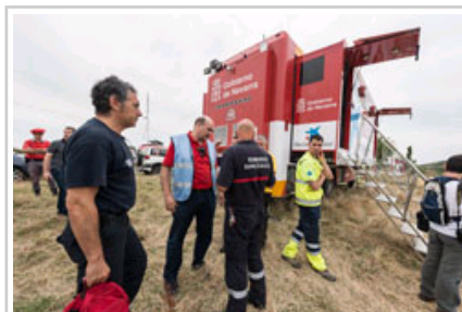
El consejero ha seguido desde el lugar las labores de extinción