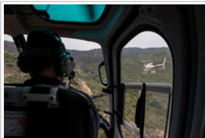
La reincorporación de los medio aéreos ha permitido acelerar el control del incendio.