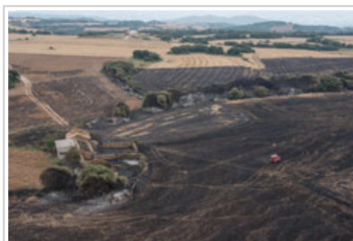
Vista aérea de la zona afectada por el fuego

El incendio declarado ayer tarde en el término municipal de Ujué ha sido ya controlado, aunque las labores de extinción total y refresco continuarán hasta mañana, según ha informado el consejero de Presidencia, Justicia e Interior, Javier Morrás, quien ha estimado en unas 900 hectáreas la superficie afectada de acuerdo a una primera estimación provisional.