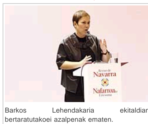
Barkos Lehendakaria ekitaldian bertaratutakoei azalpenak ematen.

Nafarroako Lehendakariak, Uxue Barkosek, Nafarroak FITURREN goizean egindako ekitaldi instituzionalean nabarmendu du Foru Erkidegoak iaiztik %30 gehitu duela Turismorako jarritako aurrekontua, eta proiektu estrategiko bat abian jarri duela, Nafarroako ekonomian eta gizartean duen tarte eta garrantzia estrategikoa ematen diona, proiektu parte-hartzailea eta orekatua, esandakoaren arabera, etorkizunera begira urratsak markatuko dituen.