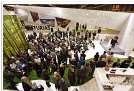
Nafarroako pabiloiaren ikuspegia ekitaldi instituzionalean

Ondoren, Lehendakariak stand-aren gaia aipatu du: "Nafarroa eratzen duten bideak; Nafarroa ezagutzeko hamaika modu". "Iparretik hegora eta ekialdetik mendebaldera –esan du-, Nafarroa natura, kultura eta historia da. Batuketa horri esker, Foru Erkidegoa lurralde aproposa da ibilbideak, bideak eta bidezidorrak egiteko, tartean Donejakuerako Bidea protagonista handia izanik. Dakizuen moduan, Nafarroan frantsesa eta aragoiera batzen dira. Horrez gain, Mendi-ibilien Sarea dugu; hau da, erkidegoko altxor natural guztiak jasotzen dituzten ia 230 kilometro, basoak, ur-jauziak, ibaiko paseoak edo igoerak, gailurrak, hegaztiak behatzeko aukera, formazio geologikoa, mitologia, trikuharriak".