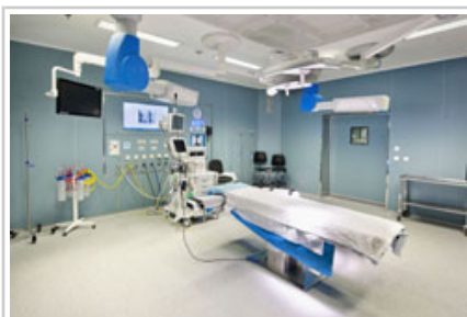
Vista de otro de los quirófanos.