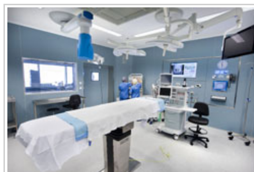
Uno de los quirófanos.

Ubicado en la primera planta, el nuevo bloque quirúrgico incrementa de manera considerable su superficie. Consta de 1.835,23 m2 construidos, un 43% más que en la actualidad. La distribución es similar al del resto de bloques quirúrgicos disponibles en el CHN, con la existencia de un "pasillo de limpio" para la entrada del personal, pacientes y material estéril, y un pasillo denominado de "sucio" para la salida del material usado tras las intervenciones