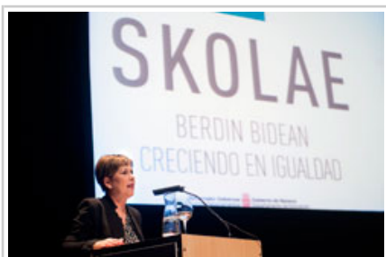
La Presidenta Barkos, durante su intervención.