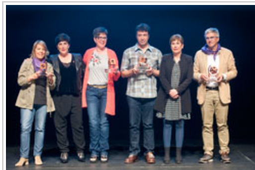
La Presidenta y la consejera con los representantes de los centros premiados por sus prácticas colectivas hacia la identidad de centro coeducador.