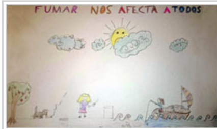
Dibujo finalista, de Azahara Treto