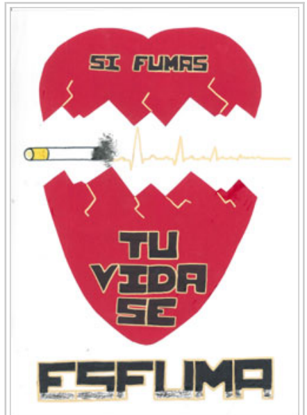
Trabajo finalista, de Andrea Chivite