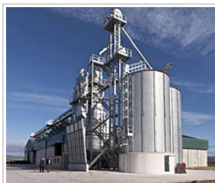
La Sarda kooperatiba.