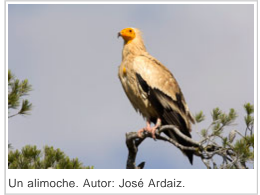
Un alimoche. Autor: José Ardaiz.

fundamentalmente, al tratamiento, cura y recuperación de aves silvestres, mamíferos y reptiles . Gestionado por GAN-NIK, el centro trata unos 700 animales al año, la mayoría aves rapaces, y una gran parte de ellas se consigue devolver al medio natural en perfectas condiciones. Se ocupan también de la atención de buen número de ejemplares de especies exóticas, la mayoría mascotas que necesitan ser reubicadas.