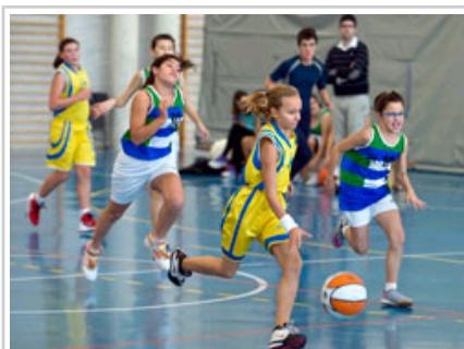
Uno de los partidos de baloncesto disputados hoy.