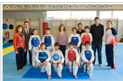
Los taekwondokas posan con la consejera y autoridades.