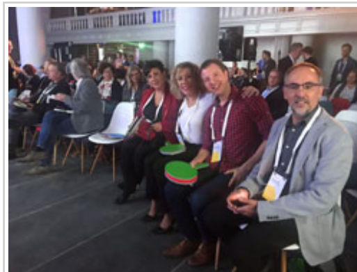
Argazki oina oharraren amaieran.

Hain zuzen ere berrikuntza da, berdintasuna eta inklusioarekin batera, Hezkuntza Departamentuaren lan ildoetako bat eta horren lanketan dihardu hezkuntza publikoan maila askotariko eraldaketa digitalaren estrategia gauzatu asmoz. Eraldaketa espazioetan, metodologietan, gaitasunetan, azpiegituretan, konektibitatean, gailuetan eta euren mantenuan, hezkuntza-baliabideetan eta ikasgeletan duten ezarpen eta kudeaketan. Hori guztia, Gobernuak berak eta kalitatezko zerbitzu publikoek duten estrategien ildo beretik landuta. Helburu hori erdiesteko 2018ko aurrekontuetan inbertsioaren zenbatekoa handitu egin zen eta 6 milioi euro bideratu dira hezkuntza zentroetako konektibitatea eta ekipamenduak hobetzeko.