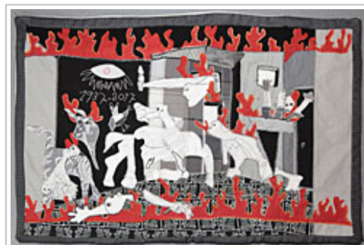
"Mi Gernika", una de las obras.