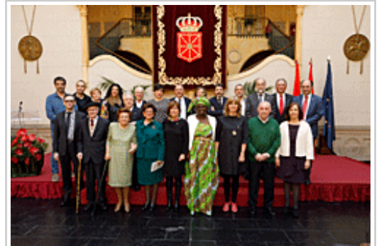
Saritutako pertsonen eta erakundeen taldeko argazkia, Barkos Lehendakariarekin eta Nafarroako gobernukideekin.

Uxue Barkos Nafarroako Lehendakaria izan da gaur goizean ospatu den Karlos III.a Noblearen Gurutzearen entrega-ekitaldiaren buru. Bertan bederatzi norbanako eta erakunde saritu dira, eta Lehendakariak “esparru desberdinetan erakutsi duten esfortzua, sormena, ekintzaitza eta erabakimena” nabarmendu ditu, “zeinak segi beharreko bidea markatzen diguten”.