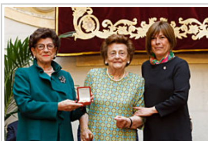
Santa María La Real Etxeko Andreen, Kontsumitzaileen eta Erabiltzaileen Elkartearen ordezkariak Karlos III.aren Gurutzaren emanaldia.