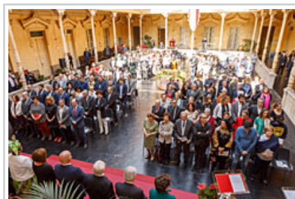
Nafarroako ereserkiarekin hasi da ekitaldia