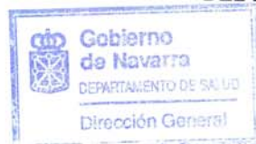
Fco. Javier Sada Goñi

EL DIRECTOR GENERAL DEL DEPARTAMENTO DE SALUD