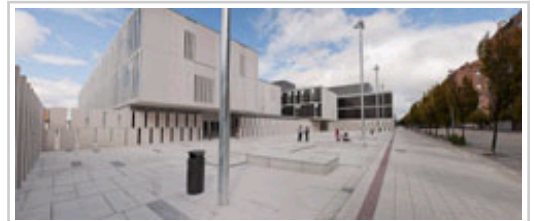
Musikaren Hirirako sarbidea kanpoko plazatik.

Aldi berean, gune horrek ikasturte honetan 15 sail didaktiko izango du (9 eta 6, hurrenez hurren) eta 55 espezialitate (32 Goi Mailako Kontserbatorioan eta 23 Profesionalean).