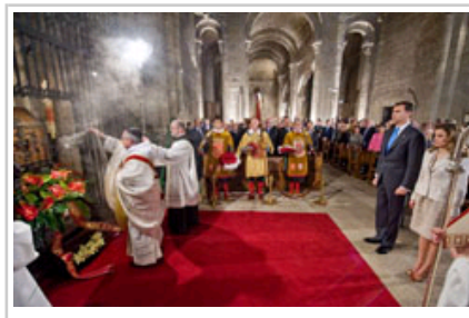
Ofrenda floral a los Reyes de Navarra.