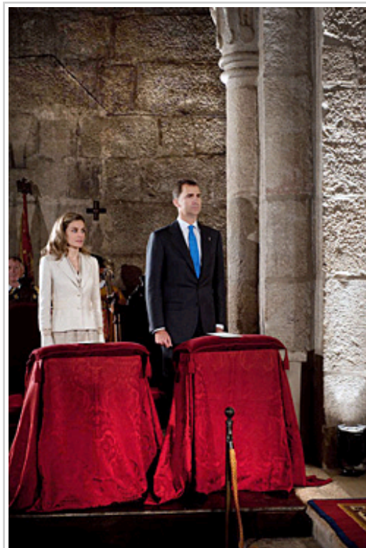
Los Príncipes, en el sitial desde el que han asistido a la ceremonia.