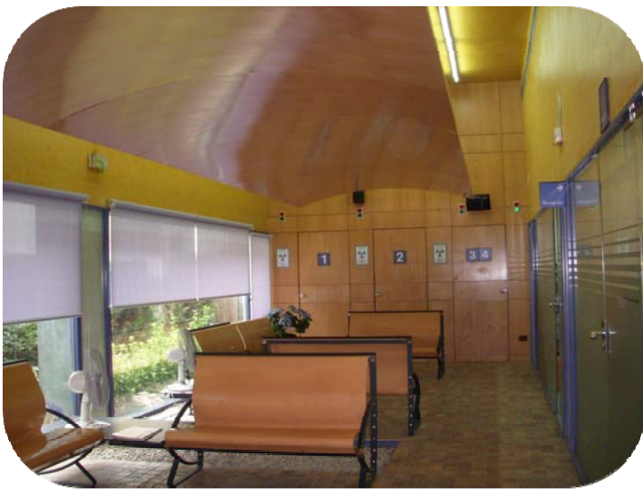
Sala de espera para la realización de mamografías

Instituto de Salud Pública y Laboral de Navarra