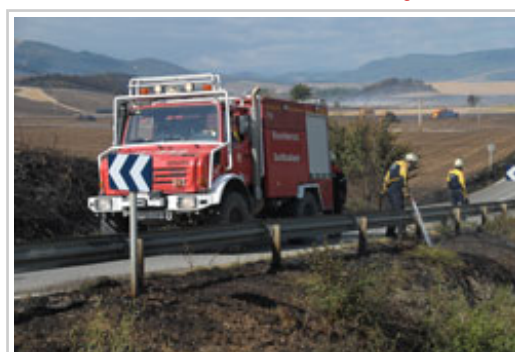
Los bomberos trabajan en la carretera NA-700.

También han acudido tres guardas forestales de la demarcación de Pamplona junto con un ingeniero forestal del Servicio de Montes y numerosos vecinos de Ororbía han colaborado en las tareas de extinción aportando sus tractores y maquinaria agrícola.