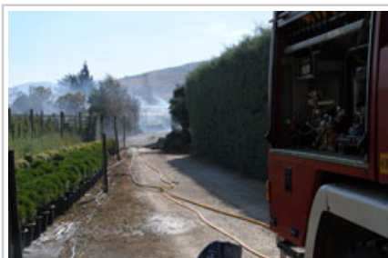
Los viveros que se han visto alcanzados por el fuego.