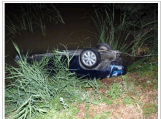
Ezbeharra izandako autoa.

Hildakoen gorpuak 05:15ak aldera eraman dituzte Iruñeko Medikuntza Legaleko Nafarroako Institutura, eta bertan egingo zaie autopsia. Atestatua Tuterako Instrukzioko 3. Epaitegira igorri da jada. Forzaingoa ezbeharra zerk eragin zuen ikertzen ari da.