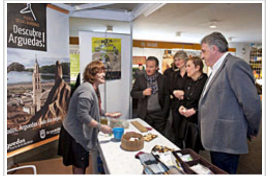
La Presidenta, el alcalde Asirón, Luis Cortés y Maitena Ezkutari, directora general de Turismo y Comercio, durante la visita a la feria.

La Feria se celebra entre hoy, viernes 26, y el domingo 28 en Baluarte, en horario de 11 a 14 y de 16 a 20,30 horas, con presencia de más de cien expositores de cuatro continentes y quinientos destinos, entre los que destacan la oferta de ecoturismo en Perú, safaris en Kenia y Tanzania y todas las posibilidades que abre un país como Zimbabwe.