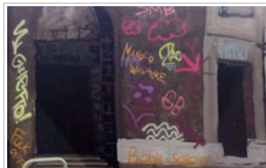
Otro muro de exposición "No parking".