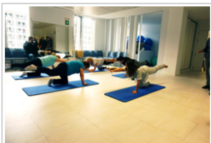
Pacientes realizando ejercicios.