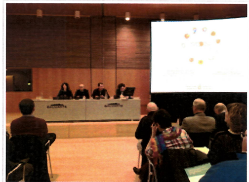
Ponentes y participantes en un momento de la jornada.

Cerca de trecientas personas han participado este martes en Baluarte en la jornada "Envejecimiento activo y saludable, buenas prácticas y oportunidades": asociaciones de personas mayores y ayuntamientos de toda la geografía navarra y también profesionales de centros sanitarios y sociales, de los distintos departamentos del Gobierno de Navarra