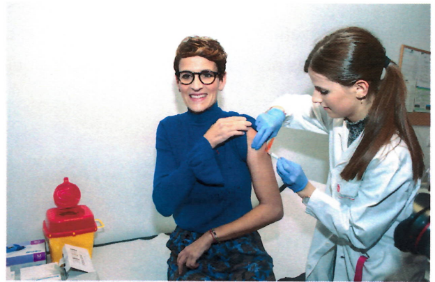
La Presidenta Chivite recibe la vacuna de la gripe.

El resto de las vacunas, 28.346, se han administrado a otros grupos de población en los que está indicada la inmunización antigripal (personas enfermas crónicas, personal sanitario, y personal de otros servicios públicos como policías, bomberos, maestros, etc.).