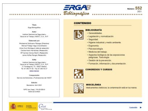
ERGA bibliográfico Nº 552