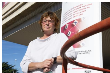
(I. Uriz/ Foku)