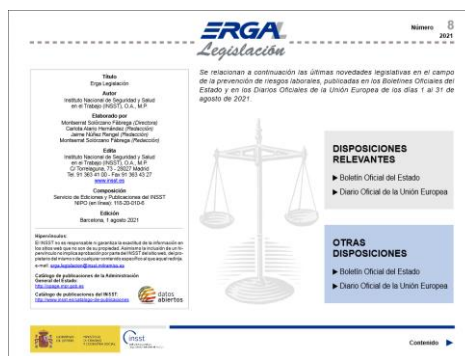
ERGA legislación Nº8