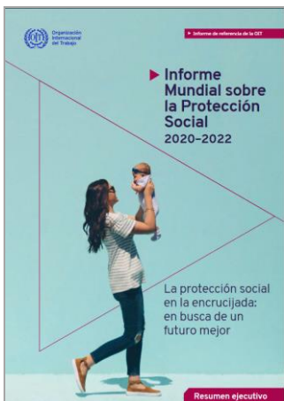
Informe Mundial sobre la Protección Social 2020-2022