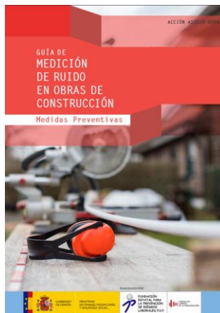
Guía de medición de ruido en obras de construcción