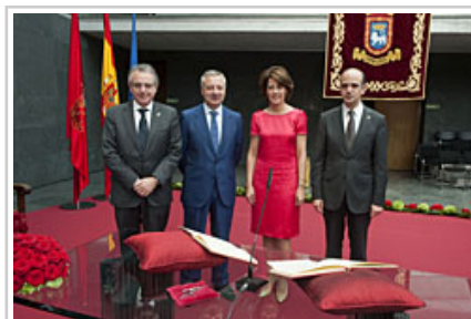
Sanz, Blanco, Barcina y Catalán, tras la investidura de la Presidenta.