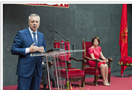
El ministro Blanco durante su discurso.