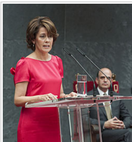
La Presidenta Barcina, durante su intervención.