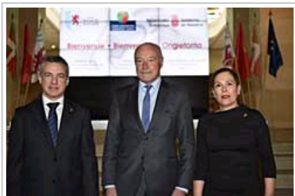
Los tres presidentes.