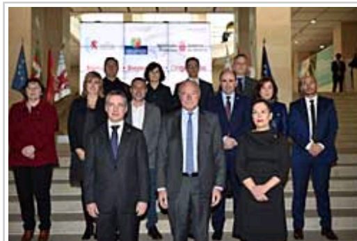
Foto de grupo previa a la asamblea.

La segunda convocatoria, relativa a la “economía, investigación e innovación” se llevará a cabo el