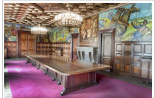
Imagen del Salón de Sesiones con las pinturas ya restauradas.

Las pinturas murales que Gustavo de Maeztu realizó en 1935 para decorar las paredes del Salón de Sesiones del Palacio de Navarra han recuperado buena parte de la viveza y la policromía original, tras los trabajos de restauración que se han acometido durante este mes de agosto, con un presupuesto de 8.688 euros.