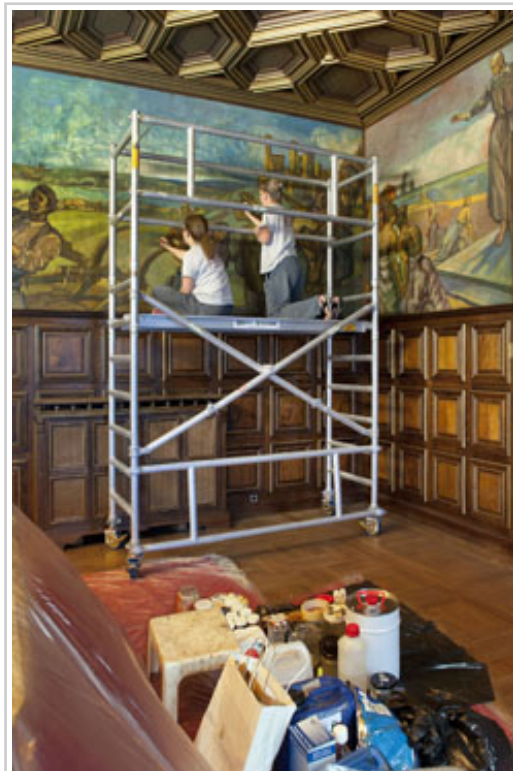
últimos retoques en el trabajo.

El acceso a la estancia se realiza a través de una pequeña antesala en la que se encuentra un bargueño renacentista de hacia 1600 con cajonería adornada con columnillas labradas en hueso y tallas