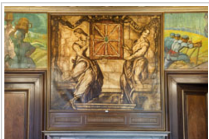
Imagen del escudo de Navarra que ocupa la parte central del lienzo.