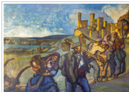
REpresentación de la Zona Media.