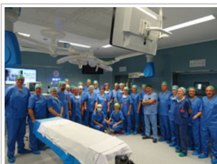
Barkos Lehendakaria osasun arloko agintariek eta bloke kirurgikoko langileekin.