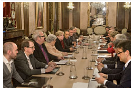
Nafarroako Kultura Kontseiluaren bilkura 2013ko Kulturaren Vianako Printzea Sariaren hautagai-proposamenerako.

Filosofoa nazioarteko aldizkari zientifiko batzuetako kontseiluko kide ere bada eta baita arte eta letren Europako akademia batzuetakoa ere.