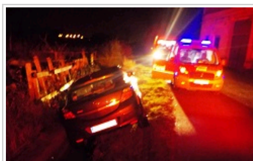
Conductora imputada tras accidentarse en Peralta

Patrullas de Tudela y Tafalla establecieron un dispositivo de vigilancia preventiva en la zona por concentración de personas. Por alcoholemias superiores a 0.65 mgr/litro han sido detenidos dos conductores, un vecino de Peralta de 43 años y otro de Funes de 34. También una mujer de Peralta de 33 años, que sufrió una salida de vía en la carretera de Marcilla conduciendo bajo la influencia del alcohol, tal y como lo atestiguó la correspondiente etilometría. Los tres imputados deberán personarse esta próxima semana en el juzgado de Tafalla para responder de su responsabilidad penal.