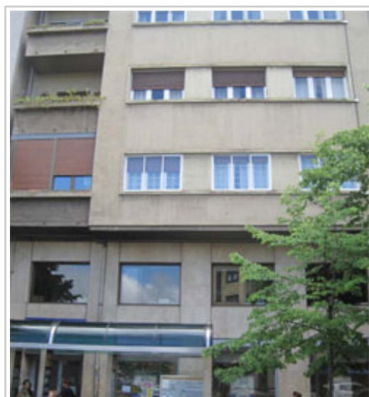
Edificio de la Avda. Baja Navarra, en Pamplona, en el que se subasta una vivienda.

Las condiciones de celebración de la subasta, así como las características de cada uno de los bienes subastados, se pueden consultar en el Portal de Contratación del Gobierno de Navarra. Las personas interesadas tienen de plazo hasta el 7 de abril para presentar proposiciones. Si previamente quieren visitar y reconocer los lotes ofertados, pueden hacerlo concertando una cita en el 848 422 972 (atención de 9:00 a 14:00).