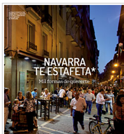
Imagen de la calle Estafeta, en castellano.