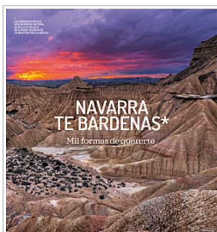
Imagen promocional de Bardenas, en castellano.