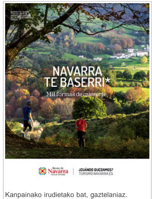
Kanpainako irudietako bat, gaztelaniaz.