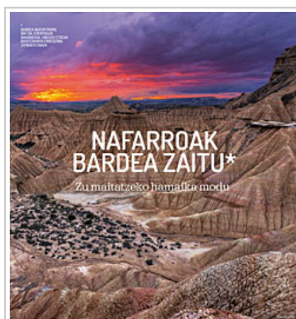
Imagen promocional de Bardenas, en euskera.