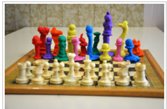
Ajedrez, de Hegoalde Ikastola.

Un total de 1.468 alumnos y alumnas de 81 grupos pertenecientes a 40 centros escolares han participado en el II Concurso Escolar “Diversidad, fuente de riqueza”, organizado por el Gobierno de Navarra.