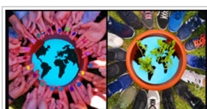
Mundos, del IES Ega