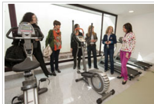
Segizioa zentroko gimnasioan.

ingurunean bizi-baldintza normalizatueta bizitzeko aukera emanez, eta horrekin talde horren instituzionalizazioa saihestuz. 65 lagunentzako lekua du: 30 eguneko arretan eta 35 arreta ambulatorioan.