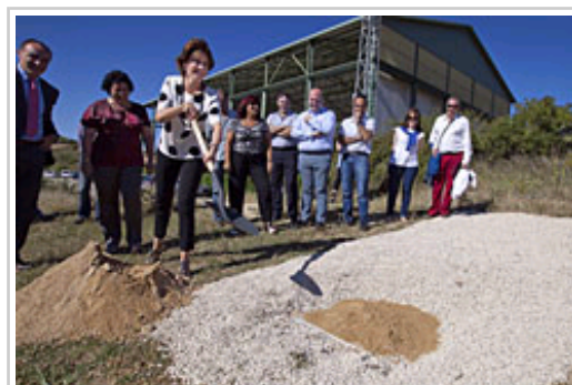
Barcina Lehendakaria, hoditeria berrirako lehen harria jartzeko ekitaldian

Nafarroako Gobernuak 2,4 milioi euro inguru emango ditu Izarbeibarko Mankomunitatea osatzen duten udalerrietako uraren hornidura hobetzeko. 11 kilometroko hoditeria eta bi ponpaketa-estazio berri eraikiko dituzte besteak beste. Sinbolikoki hasi dituzte obrak astearte honetan lehen harria jartzeko ekitaldian.