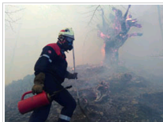
Un bombero participante en la extinción del incendio.

Los bomberos han dado por controlado esta tarde el incendio declarado la noche del jueves en una zona de barrancos con fuertes pendientes de los barrios de Eguzkialdea y Aientsa, en el término de Arantza, tras afectar a una superficie de unas 130 hectáreas, según estimaciones provisionales. Parte de los efectivos que han trabajado en las labores de extinción han ido regresado a sus parques, aunque permanecerá en el lugar un importante retén para realizar tareas de remate y atajar una posible reactivación de las llamas a partir de los rescoldos, ya que las condiciones meteorológicas siguen siendo adversas.