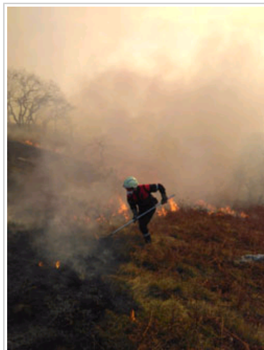
El trabajo se realiza con herramientas manuales.

Arantza es una de las localidades del norte de Navarra en las que se ha prohibido el uso de fuego por riesgo de incendios mientras se mantengan las actuales condiciones meteorológicas. La meteorología de esta campaña invernal se está caracterizando por un severo periodo de sequía, altas temperaturas para la época, bajos índices de humedad y vientos dominantes de componente sur, lo que genera una situación en la que el riesgo de incendios forestales es muy elevado. Esta prohibición se refiere a quemas de matorral, de resto de cortas o podas y otros trabajos selvícolas.