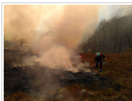
Un bombero apaga las llamas con el batefuegos.