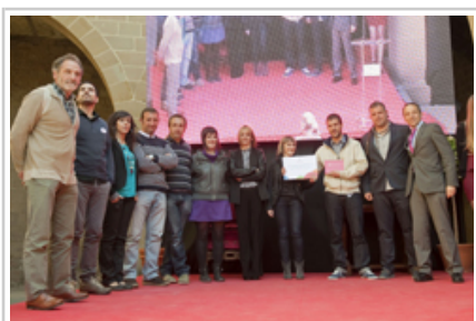
Olloko Gure Sustraiak aterpetxe turistiko eta baserri-eskolako ordezkariak jaso dute saria turismo-zerbitzuen ikerketa, garapen, berrikuntza eta eskaintzaren modalitatean.