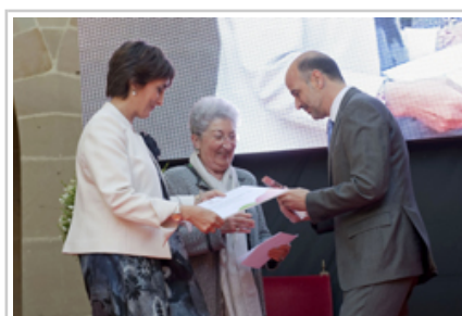
Ultzamako Benta jatetxeko ordezkariak, jatetxeen modalitateko irabazleak.