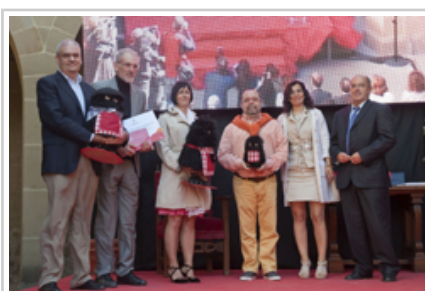
Nafarroako Landa Hotelen Elkarteko (Reckrea) ordezkariak, toki-entitate, turismo-partzuergo eta elkarten saileko irabazleak.