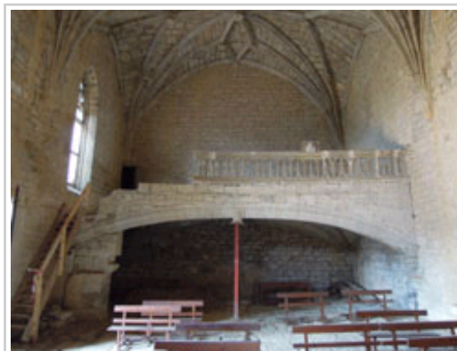
Vista del interior previamente a las obras.