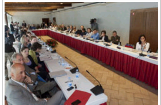
Autonomia-erkidegoen eta garapenerako lankidetzaren topaketa. Bileraren ikuspegi orokorra.