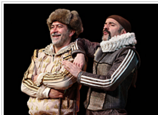
Obra "Rinconete y Cortadillo", programada para el sábado en La Cava de Olite.

http://www.culturana Navarra.es/es/agenda/2017-07-11/exposiciones/jose-ramon-anda-causa-formal-y-materia