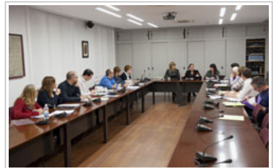
Un momento de la reunión.

La Comisión Interdepartamental de Igualdad, presidida por la presidenta Uxue Barkos Berruezo, ha conocido hoy los principales proyectos estratégicos en materia de igualdad entre mujeres y hombres que está llevando a cabo el Gobierno.