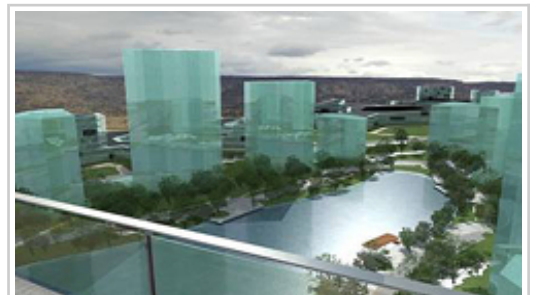
Lago en torno al que se prevén ordenar las distintas edificaciones.