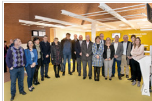
Ver pie de foto al final de la información.

”Es decir, un lugar de promoción de la autonomía, de activación laboral y de atención personalizada, centrado en las personas y en las empresas”, ha dicho. La Presidenta ha subrayado que es la primera oficina de una comunidad autónoma que integra en un mismo edificio todos los servicios de empleo. Este modelo, ha precisado, se va a extender en el segundo semestre del año a Altsasu / Alsasua , en donde se está habilitando una nueva agencia; y el objetivo es adaptar el resto de agencias, empezando por Tudela.