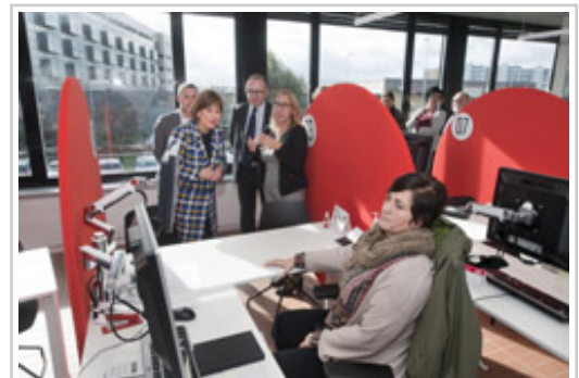
La Presidenta Barkos visita una de las salas de la agencia integral de Empleo Iturrondo.

La Presidenta de Navarra, Uxue Barkos, ha presidido hoy la inauguración de la agencia integral de empleo Iturrondo, situada en Burlada / Burlata. Tras una inversión de 2.840.000 euros y con una subvención del Servicio de Empleo Público Estatal (SEPE) del 1,26 millones, este edificio, exclusivamente utilizado como centro formativo, ha pasado a ser una agencia integral de empleo.