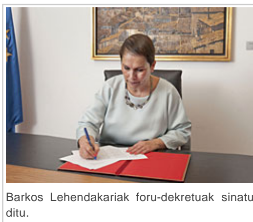
Barkos Lehendakariak foru-dekretuak sinatu ditu.

Nafarroako Lehendakari Uxue Barkosek Foru Administrazioaren departamentuen egitura finkatzeko duen foru-dekretua sinatu du asteazken honetan. Bederatzi departamentutan antolatuta geratu da Administrazioa eta arlo bakoitzaren buru izango diren kontseilariak izendatu ditu; kontseilari horiek ostegun honetan, uztailak 23, beren departamentuen kargu egingo dira, Nafarroako Jauregiko Tronuaren Aretoan, 12:00etan, egingo den ekitaldian.