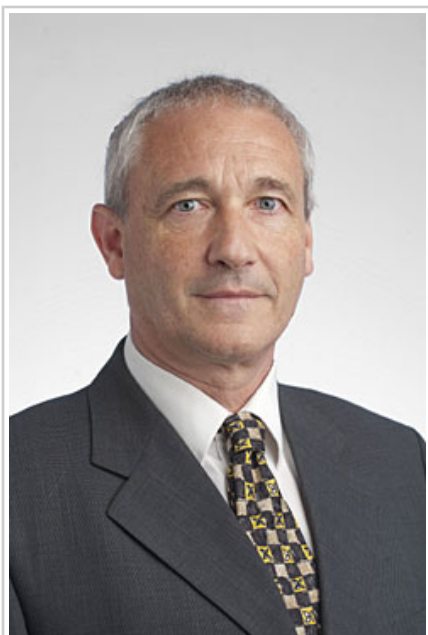
Mikel Aranburu Urtasun, Ogasuneko eta Finantza Politikako kontseilaria.