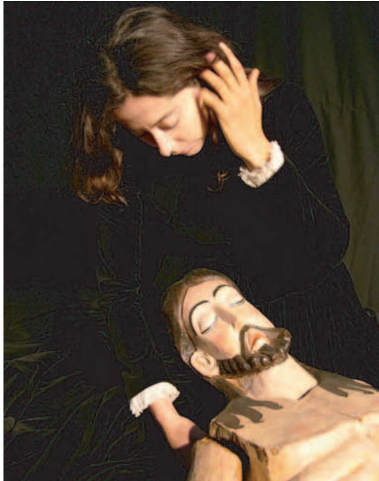
Misterio del Cristo de los Gascones