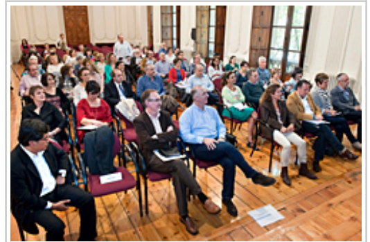
Público asistente a la jornada.

Este órgano ha previsto la realización, el próximo mes de septiembre, de un curso sobre bioética en la práctica clínica y dirigido a profesionales de la salud. En él se abordarán los fundamentos de esta disciplina y la legislación relacionada, así como herramientas emocionales para evitar y resolver conflictos surgidos en la práctica clínica.