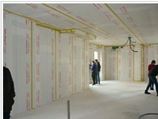
Vista interior del bajo de Rotxapea, durante las obras.

Una reciente modificación de la normativa de usos en el Plan Municipal del Ayuntamiento de Pamplona abrió la puerta en la capital navarra a compatibilizar usos en los bajos de los edificios y a la posibilidad de reconvertir bajeras en viviendas en aquellas zonas de la ciudad con escasa actividad comercial. Aunque no han proliferado los propietarios que hayan solicitado permiso para esta reconversión, Nasuvinsa se ha propuesto explorar esta vía en sus promociones como fórmula para ampliar la oferta de alquiler social en viviendas totalmente accesibles y muy versátiles en su tipología para atender distintas necesidades especiales.