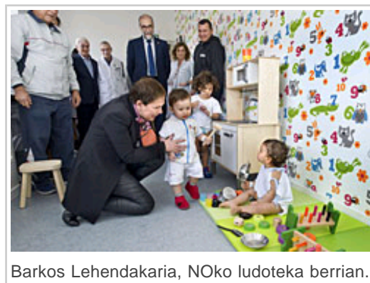
Barkos Lehendakaria, NOko ludoteka berrian.

Nafarroako Ospitalegunek ama-umeentzako eraikineko laugarren solairuko ospitaleratze-eremua eraberritu du; 2.600 adingabe baino gehiago ospitaleraten dituzte urtero solairu horretan. Lau hilabete behar izan dituzte lanak egiteko eta, horiei esker, nabarmen hobetu dira solairuko ospitaleratze-baldintzak eta profesionalentzako lan-espazioa.