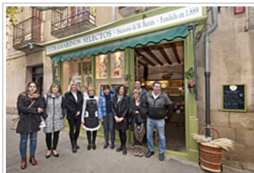
La campaña se enmarca en las acciones de apoyo al sector del Gobierno de Navarra.

La campaña se enmarca en las acciones de apoyo al sector del Gobierno de Navarra, que cuenta con cuatro convocatorias de ayudas para el sector comercial minorista, por un importe global de 1.295.000 euros, de los que se ejecutarán 1,05 millones: 481.000 euros para inversiones en establecimientos comerciales (28 empresas subvencionadas); 480.000 euros para 28 asociaciones de comerciantes (se resolverá en breve); 75.000 euros para apoyo a emprendedores comerciales (16 empresas subvencionadas); y 14.920 euros para formación del sector (4 asociaciones subvencionadas).